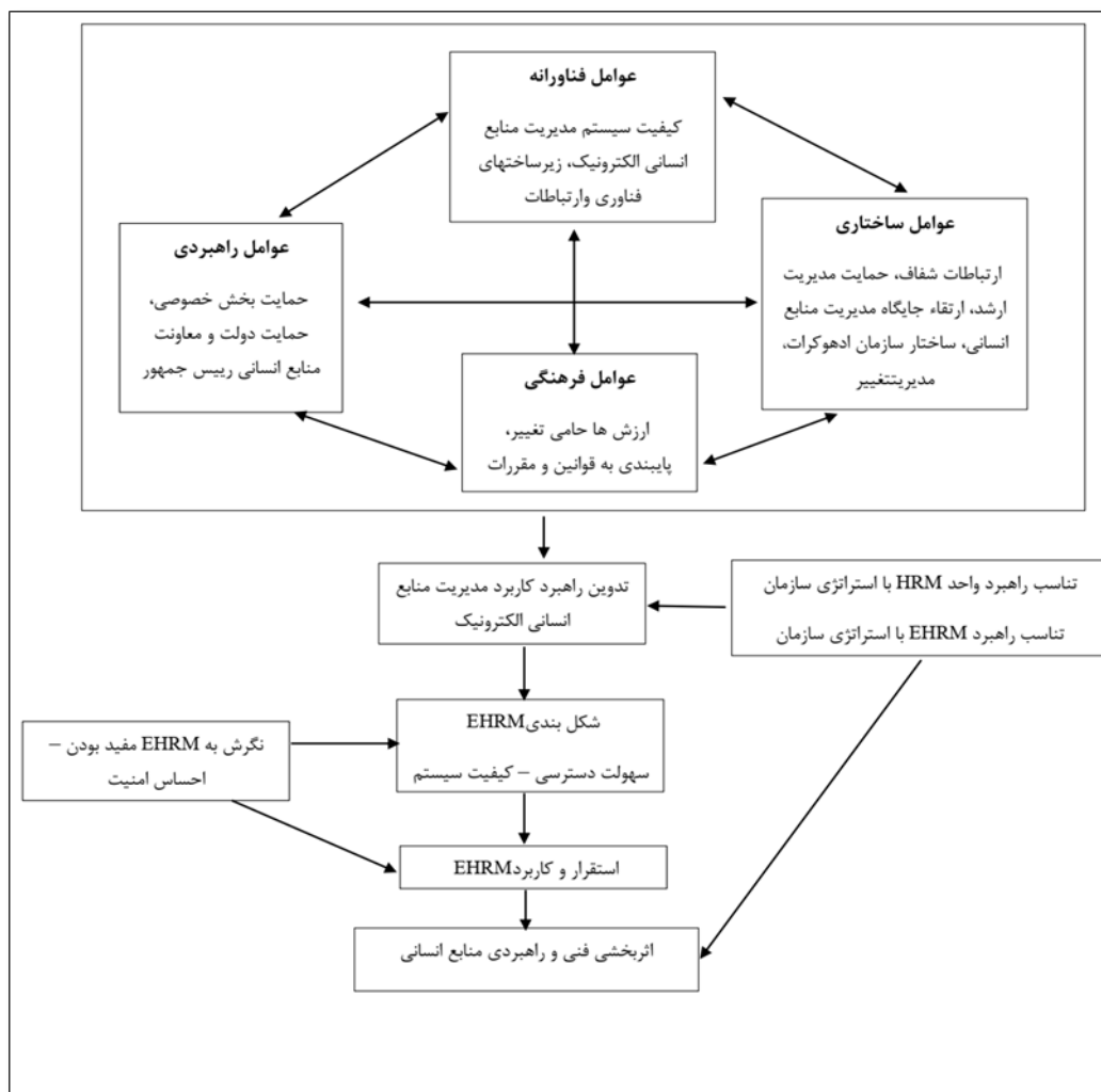
شکل ۳. مدل اولیه استقرار مدیریت منابع الکترونیک در نیروی دریایی ارتش

در ادامه با انجام مصاحبه مجدد با برخی از خبرگان تحقیق، ضمن بررسی مدل اولیه از سوی خبرگان، اصلاحاتی در ارتباط بین مؤلفه‌ها اعمال و مدل نهایی تحقیق طراحی و مجدداً به خبرگان تحقیق ارسال شد و پس از تأیید ۷ نفر از خبرگان نیروی دریایی ارتش، مدل نهایی ارائه گردید (شکل ۴).